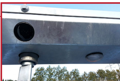
I taket på grinden er det lys, samt lys for retningsanvisning.