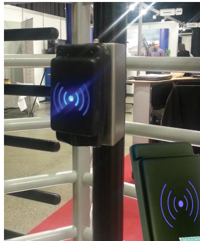
Vi kan levere grinden med ferdig påsatt lesere for registrering av byggekort. Enkelt og komplett IT-system for mannskapskontroll. Rotasjonsgrinden er utstyrt med festebreketter for leser.