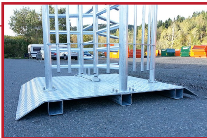
Leveres som standard med bunnplate i stål. Tilgjengelig med flat plate eller plate som har åpning for gaffeltruck (som på bildet).